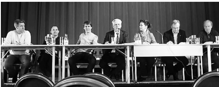
Länets riksdagspolitiker utfrågas ang skifferbrytning o fick alla en påse äkta Latorpsslagg med sig hem