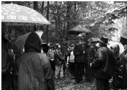
I strilande heldagsregn samlas 35 personer för att guidas i reservatet