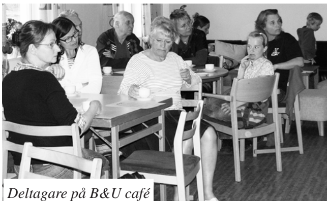
Deltagare på B&U café

...var att jämka så väl som möjligt för att både ryttare, joggere, mopedister, cyklister, rullskid- och inlinesåkare ska kunna färdas så säkert och bra som möjligt. Det kommunen fick med sig hem var; att fortsätta utreda en asfaltering av del av banvallen med en "barriär" av grövre grus därefter rid- & joggingvänligt grus. Vi förordade också att EU-mopeder bör få åka här dock med hastighetsbegränsning.