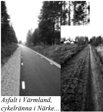
Asfalt i Värmland, cykelränna i Närke...