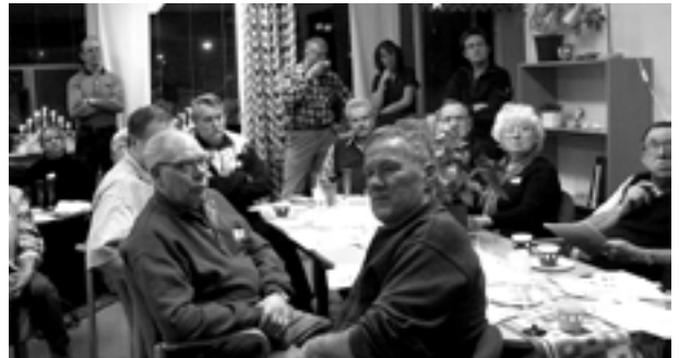
Deltagare på Leaderträff i Garphyttan

Hela strategin finns på: latorpsbyalag.se o mellansjolandet.se - remisstid tom 28/2, kommentera den gärna!