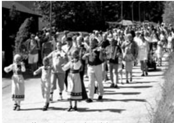
En maffig parad, avgång från Niemis mjölkhus