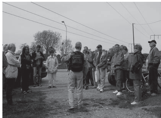
Bild från Tysslingedagen 2004